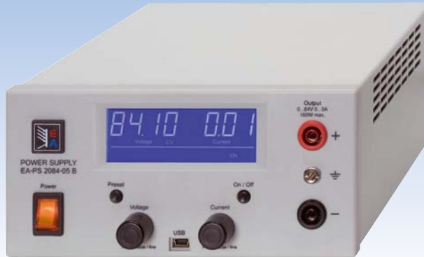
EA-PS 2084-05 B