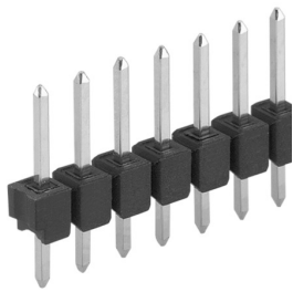
Leiterkartensteckverbinder>Stiftleisten Einreihig, □ 0,635 mm