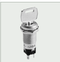
einpolig 9500.0101 E E